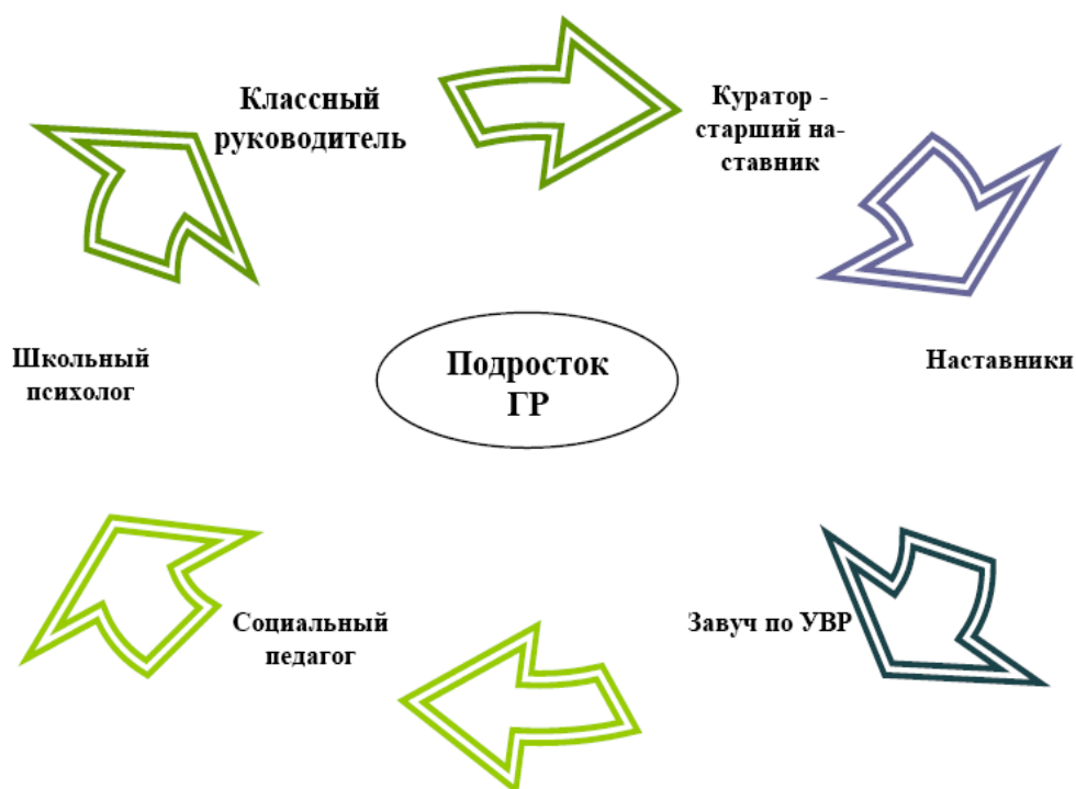
Рис. 3 Схема взаимодействия сопровождения подростка группы риска